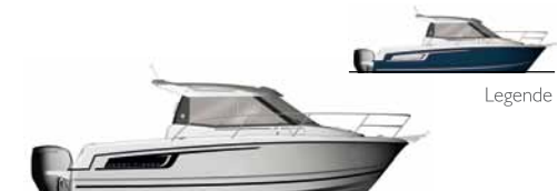
Merry Fisher 755