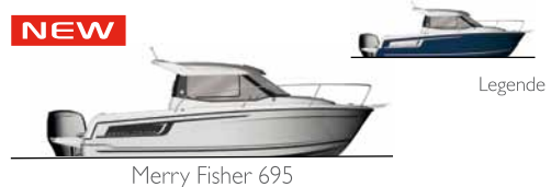
Merry Fisher 695