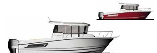
Merry Fisher 755 Marlin