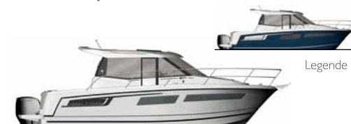
Merry Fisher 855