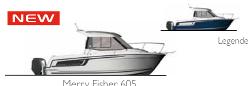
Merry Fisher 605