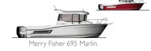
Merry Fisher 695 Marlin

fas yachting prodej lodí a příslušenství