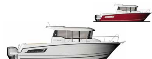
Merry Fisher 855 Marlin